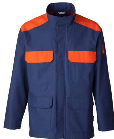
1L0912 CE FR WELDERPRO JAKNA AQM/NSO