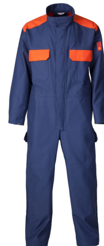
1L2837 CE FR WELDER KOMBINEZON AQM/NSO