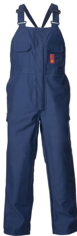
1L0916 CE FR WELDERPRO HLAČE Z OPRSNIKOM AQM