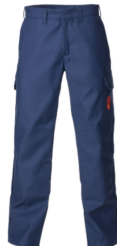
1L0914 CE FR WELDER HLAČE CL2 AQUAM